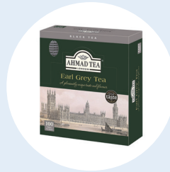
영국의 아마드 (Ahmad Tea)