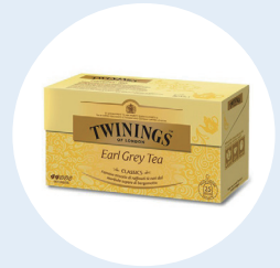
영국의 트와이닝 (Twinings)