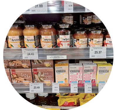
유통매장 에온(Aeon)내 한국산 차 판매 매대

말레이시아 내에서 가장 인지도가 높은 한국산 차는 액상차 종류이다. 유자차를 시작으로 알로에, 대추, 생강, 레몬, 석류 등 다양한 맛과 용량으로 출시되고 있다. 2022년 기준 대 말레이시아 유자차 수출 실적은 416천불 수준으로 전년 대비 62.5%나 증가하였다. 할랄 인증으로 무슬림까지 포함한 폭넓은 소비자를 공략할 수 있었고, 따뜻한 차를 선호하는 중국계 소비자에게도 좋은 반응을 얻은 것이 인기요인으로 분석된다. 특히 팬데믹 이후 건강함 음료를 찾고자 하는 사회 분위기 속에서 기관지 등 건강에 좋은 성분이 풍부하면서 단맛을 놓치지 않는다는 점이 남녀노소가 함께 즐길 수 있는 품목으로 평가돼 앞으로도 꾸준한 인기가 기대되는 품목이다.