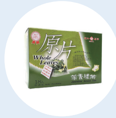
대만의 텐렌 (Ten Ren Tea)