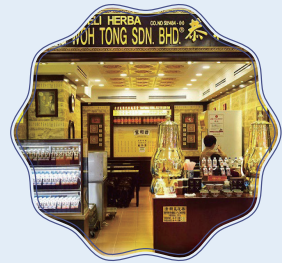
중국식 허브티 쿵위통 (Koong Woh Tong)