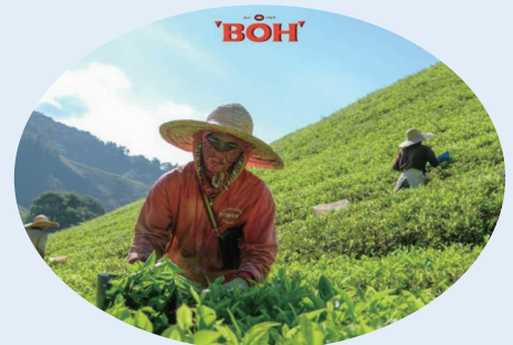
대표적인 차 생산지인 카메론 하일랜드 (Cameron Highland)