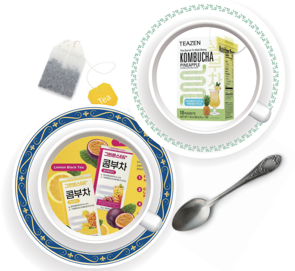
현지 H&B 스토어 왓슨스(Watsons)와 가디언(Guardian)에서 판매중인 한국산 콤부차

최근 말레이시아 내에서 한국산 콤부차가 다양하게 소개되는 추세이다. 현지에서 한국에 대해 가지고 있는 긍정적인 이미지 중 하나가 다이어트, 화장품 등 뷰티 관련 문화가 발달했다는 점인데, 이런 부분에서 착안하여 다이어트에 도움이 되는 콤부차를 홍보하고 있다. 편의점, H&B 스토어, 하이퍼 마켓 등 다양한 유통매장에 입점했으며 현지에서 흔하게 유통되는 RTD 형태 콤부차에 비해 휴대가 간편하다는 점에서 젊은 층 사이에서 꾸준히 입소문을 타고 있는 제품이다.