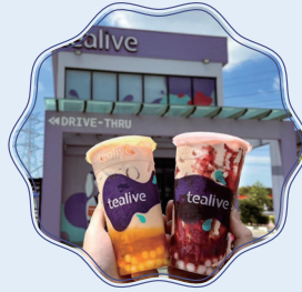
버블티 티라이브 (Tealive)