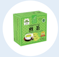
일본의 OSK 센차 (OSK Sencha Green Tea)