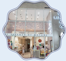
과일티 핀티 (Pin Tea)