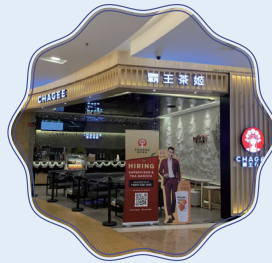
밀크티 차지 (Chagee)