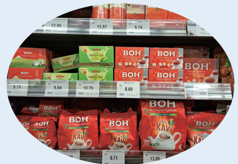
유통매장 에온(Aeon) 내 보(Boh)의 제품 판매 매대